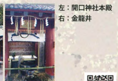
左: 開口神社本殿 右: 金龍井